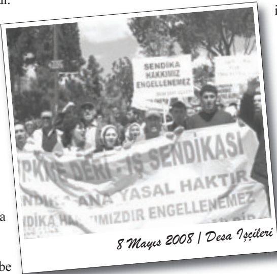
8 Mayıs 2008 | Desa İşçileri

Küçükçekmece İşçi Platformu da basın açıklamasına "Sendika hakkımız engellenmez!", "Atılan işçiler onurumuzdur!", "Desa işçisi yalnız değildir!" dövizleriyle katıldı.