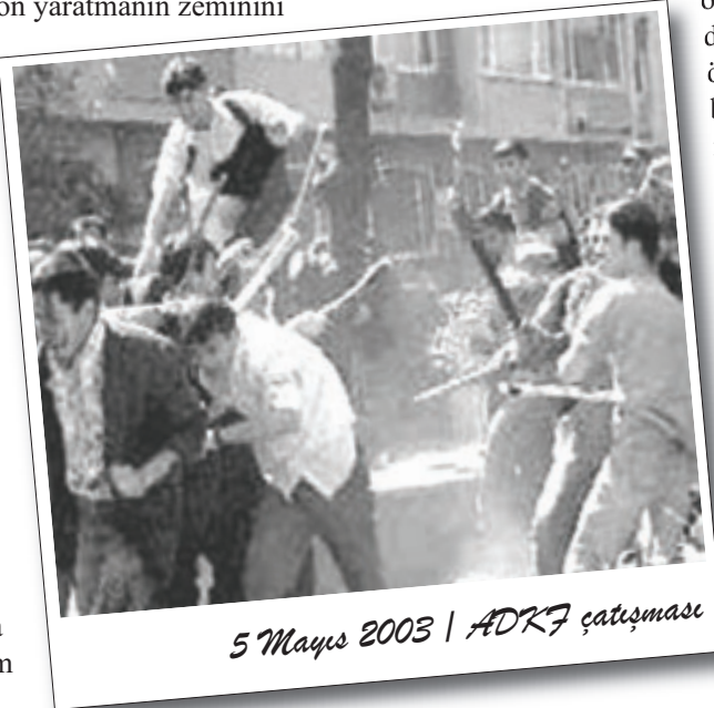
5 Mayıs 2003 | ADKÇ çatışması

YTÜ'de yaşanan süreç içerisinde diğer bir ibretlik