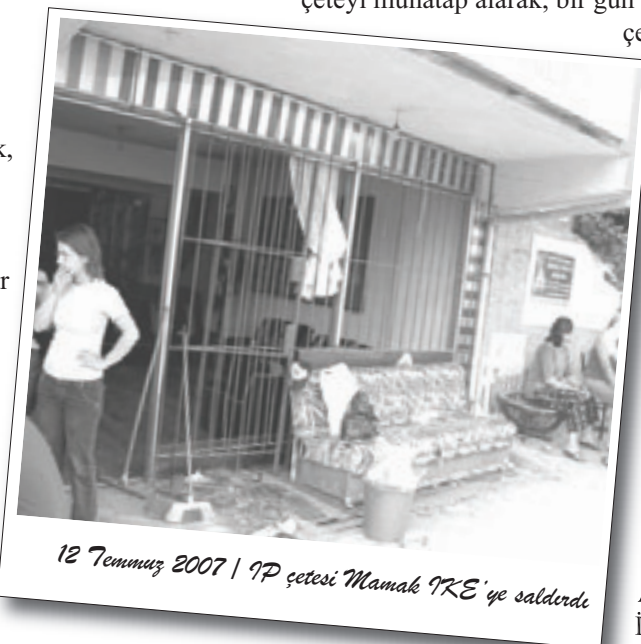
12 Temmuz 2007 | İP çetesi Mamak TKE'ye saldırdı