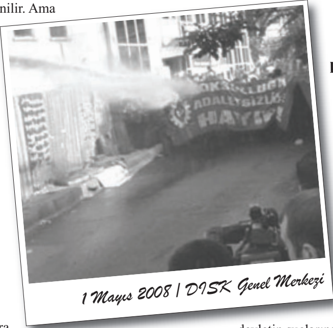
1 Mayıs 2008 | DİSK Genel Merkezi