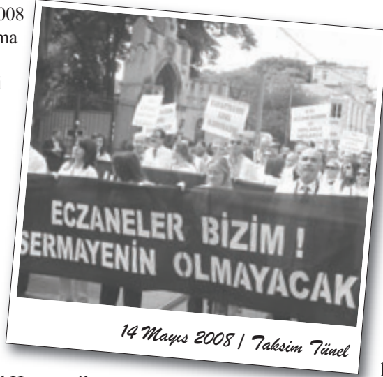
14 Mayıs 2008 | Taksim Tünel