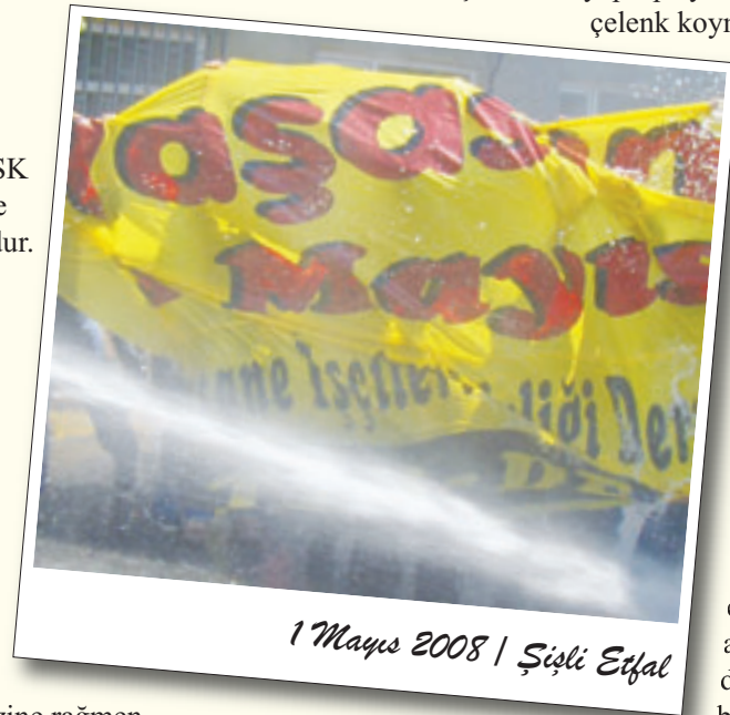
1 Mayıs 2008 | Şişli Etfal