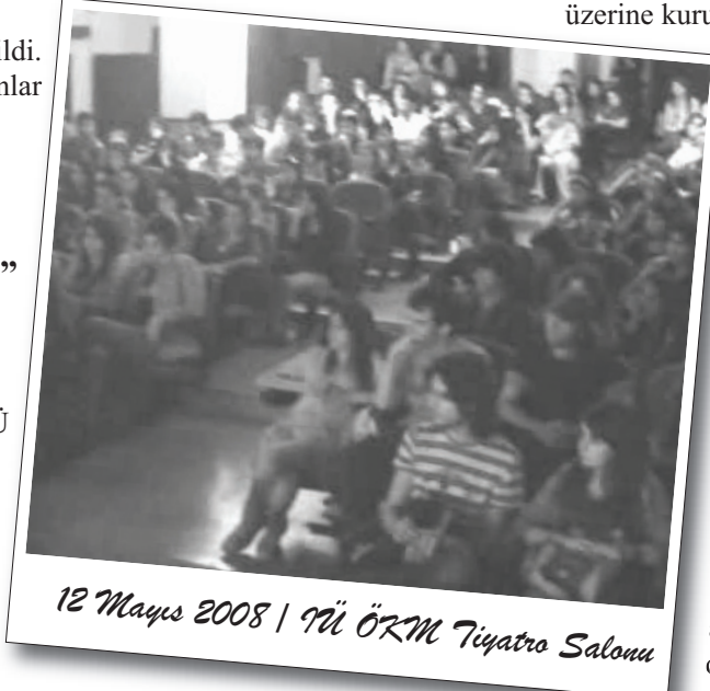
12 Mayıs 2008 | İÜ ÖKM Tiyatro Salonu