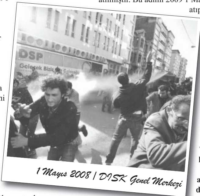
1 Mayıs 2008 | DİSK Genel Merkezi