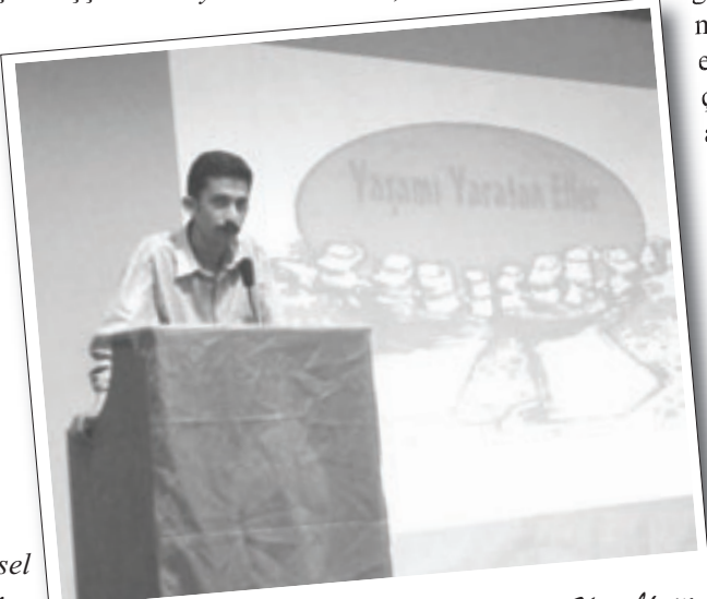
11 Mayıs 2008 | Çiğli İşçi Kurultayı