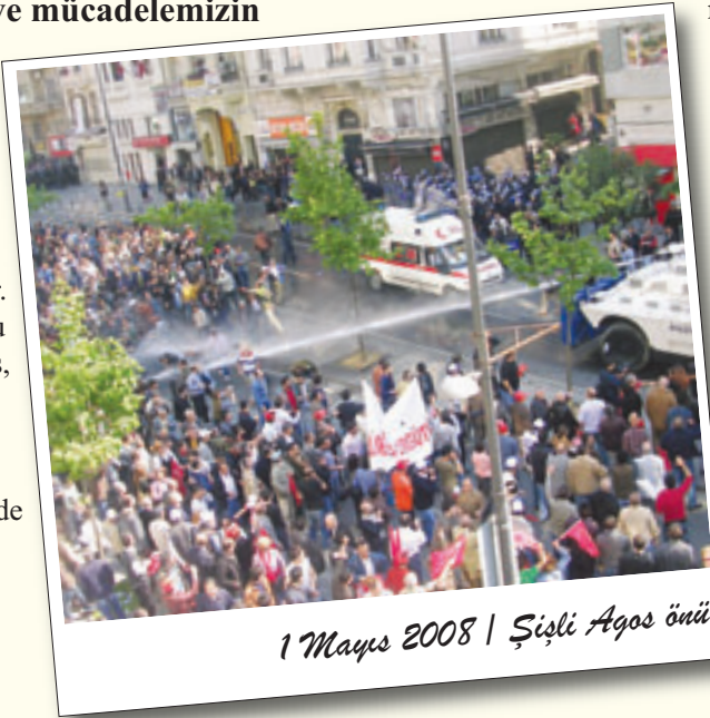
1 Mayıs 2008 | Şişli Ağos önu

Hak alma mücadelesinde önce meşruluğa inanç gelir. Hakkın olanı almak istiyorsan onun meşruluğuna inanmalısın. Ve sonra kendi meşruluğuna. Bu ülkede