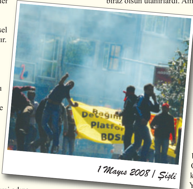
1 Mayıs 2008 | Şişli

Hızlarını alamadılar bu kez de avukatlara saldırdılar. Yetmedi Adliye'nin içine gaz bombası atıldı. Durmadı terör. ÖDP il binası basıldı, içerdekilerin üzerine ateş açıldı, gaz bombaları atıldı. Gazetecilerin kolunu kırdılar. Yetmedi turistleri copladılar. Devlet