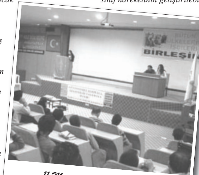
11 Mayıs 2008 | Çiğli İşçi Kurultayı