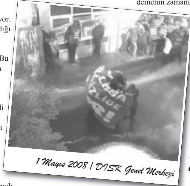
1 Mayıs 2008 | DİSK Genel Merkezi