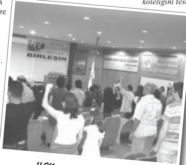
11 Mayıs 2008 | Çiğli İşçi Kurultayı

sunuldu. Çalışma yaşamında kadın işçilerin hak gasplarına,