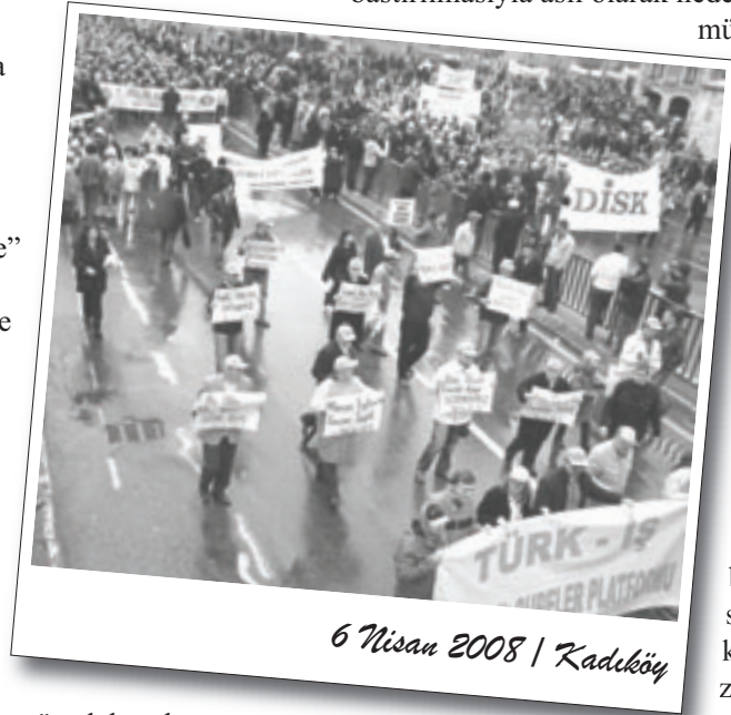
6 Nisan 2008 / Kadıköy

mücadeleye dönük olan ve son süreçte ciddi bir özgüven kazanmış bulunan sınıf güçleridir. Zira muhalif sendika yöneticilerini de ayakta tutan ve ağa takımına karşı kafa tutmaya zorlayan bu alandaki birikimdir. Eğer bu birikim dağıtılabılırsa, tabanda mayalanan mücadele gücü zayıflatabilir, böylece muhalif sendikal güçler de kolaylıkla itaate zorlanabilir. İşte Türk-İş ağalarının hesapları